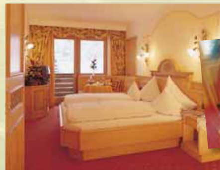
Ferienzimmer „Smaragd“ 29 m 2 mit Balkon