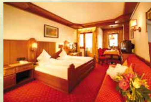
Ferienzimmer „Bergfex“ 35-40 m 2 mit Balkon