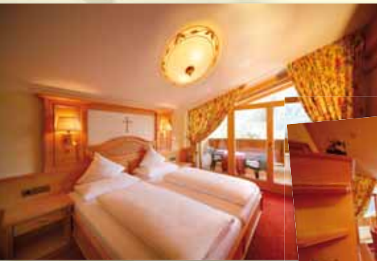
Die neue Suite „Brillant“ 85 m 2 mit Balkon