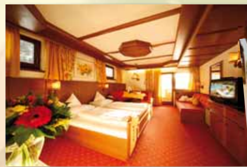
Komfortappartement „Kaiserblick“ 48 m 2 mit Balkon