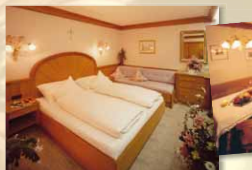
Komfortappartement „Steinplatte“ 40 m 2 mit Balkon