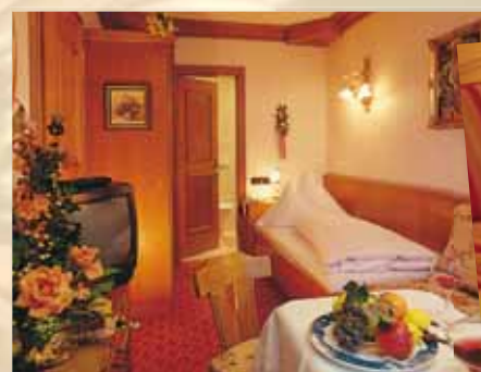
Einzelzimmer „Opal“ 20 m 2 mit Balkon