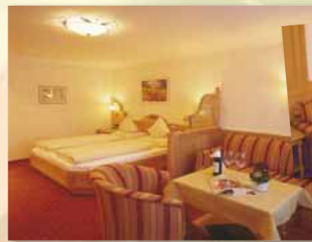
Wohnkomfortzimmer „Saphir“ 35 m 2 mit Balkon