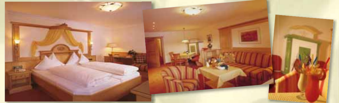
Suite „Rubin“ 85 m 2 mit Balkon