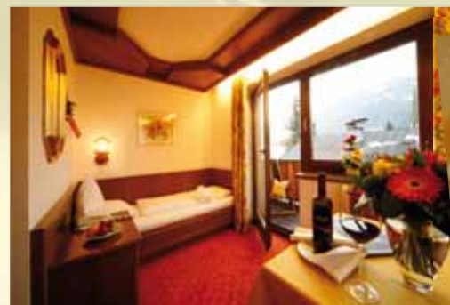
Einzelzimmer „Fellhorn“ 19 m 2 mit Balkon