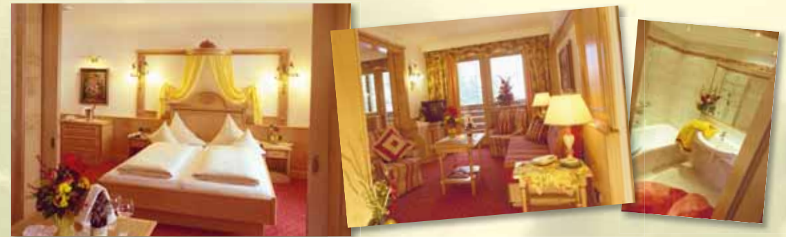
Suite „Romantik“ 60 m 2 mit Balkon