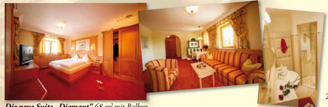
Die neue Suite „Diamant“ 68 m 2 mit Balkon