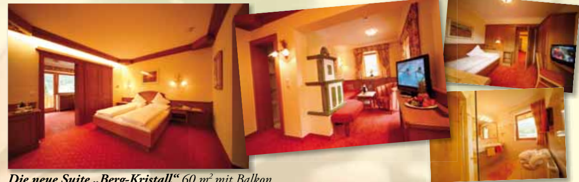
Die neue Suite „Berg-Kristall“ 60 m 2 mit Balkon