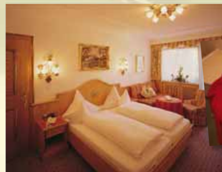
Wohnkomfortzimmer „Jade“ 35 m 2 mit Balkon